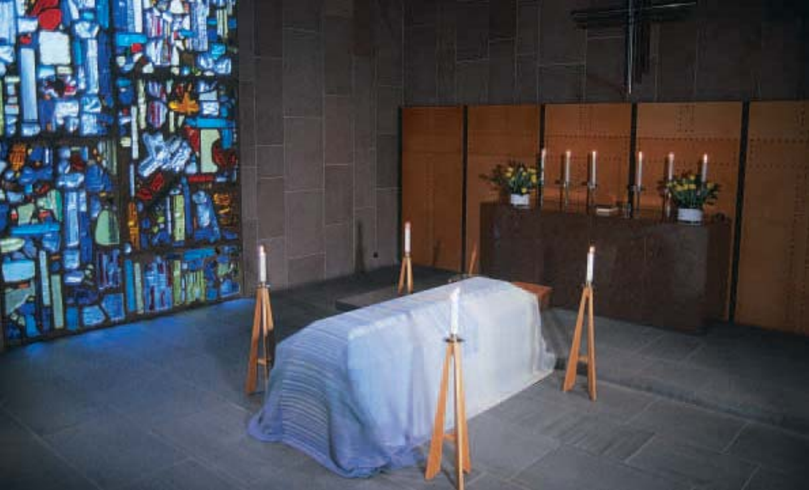
Bårtäcke i Trons kapell, Limhamns kyrkogård