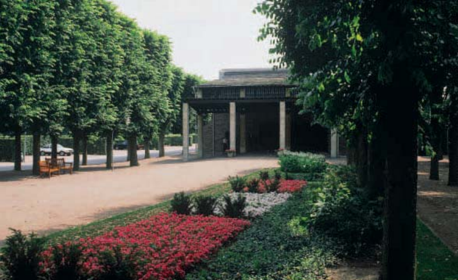
S:ta Getruds kapell, Östra kyrkogården