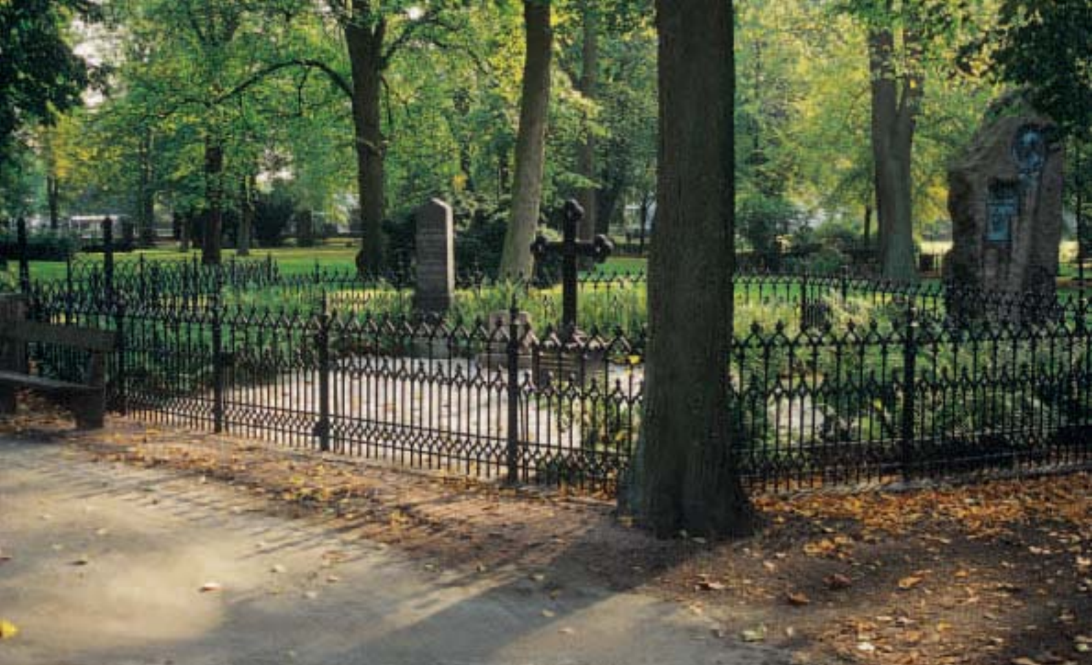
Gravkvarter, Gamla kyrkogården